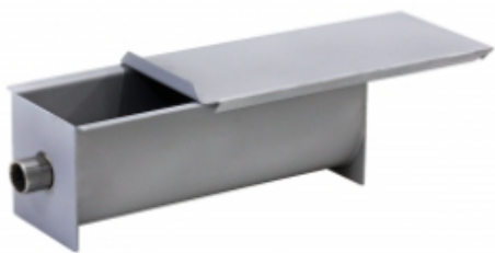
ФОРМА ДЛЯ КЕКСА ПОЛУКРУГ С КРЫШКОЙ 76X200X76 НЕРЖАВЕЮЩАЯ СТАЛЬ