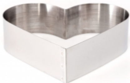
ФОРМА "СЕРДЦЕ" 260X70 НЕРЖАВЕЮЩАЯ СТАЛЬ