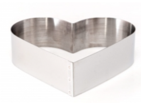
ФОРМА "СЕРДЦЕ" 270X50 НЕРЖАВЕЮЩАЯ СТАЛЬ