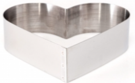
ФОРМА "СЕРДЦЕ" 270X60 НЕРЖАВЕЮЩАЯ СТАЛЬ