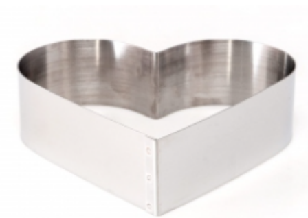
ФОРМА "СЕРДЦЕ" 170X80 НЕРЖАВЕЮЩАЯ СТАЛЬ